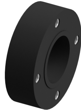
Megjegyzés | C1 típus (EPDM) - gumikompenzátor | 3D nézet

Részletes műszaki adatok a C1 típusú gumikompenzátorokhoz a következő táblázatban és a dokumentumokban találhatóak, vagy Lépjén velünk kapcsolatba .