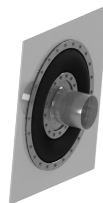
Megjegyzés | szövetkompenzátor - 35-ös típus | 3D nézet

Részletes műszaki adatok a 42 típusú szövetkompenzátorokhoz a következő táblázatban és a dokumentumokban találhatóak, vagy Lépjén velünk kapcsolatba .