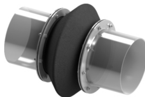
Megjegyzés | szövetkompenzátor - 33-as típus | 3D nézet

Részletes műszaki adatok a 33 típusú szövetkompenzátorokhoz a következő táblázatban és a dokumentumokban találhatóak, vagy Lépjén velünk kapcsolatba .