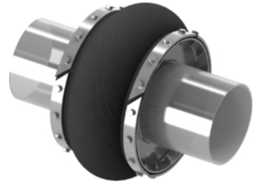
Megjegyzés | szövetkompenzátor - 22-es típus | 3D nézet

Részletes műszaki adatok a 22 típusú szövetkompenzátorokhoz a következő táblázatban és a dokumentumokban találhatóak, vagy Lépjén velünk kapcsolatba .