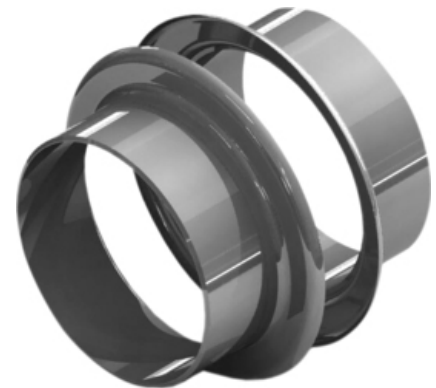
Megjegyzés | M-LENS típus - speciális kompenzátor | 3D nézet